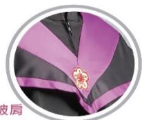
● 碩士校徽披肩 經典剪裁/精緻電繡