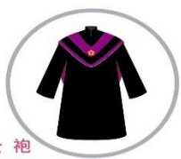
● 碩士袍 修身俐落/親膚透氣