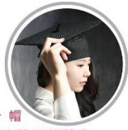
● 學士帽 輕量木質 / 硬挺質感