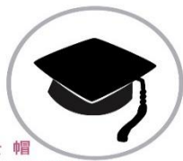
● 碩士帽 輕量木質/硬挺質感