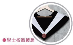
● 學士校徽披肩 經典剪裁 / 精緻電繡